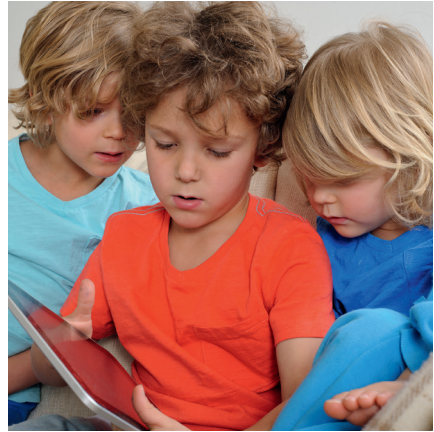
Tijdens het spelen raken de hoofden elkaar en kan hoofdluis zich verspreiden.

Hoofdluis heeft niets te maken met wel of niet schoon zijn. Het kan iedereen overkomen. Hoofdluizen lopen via het haar over van hoofd naar hoofd. Hoofdluizen zoeken graag een warm plekje op; bijvoorbeeld in het haar achter de oren, in de nek of onder een pony. Kinderen krijgen gemakkelijk hoofdluis, omdat tijdens het spelen de hoofden elkaar soms raken. Hoofdluizen verspreiden zich ook makkelijk bij pubers. Dat kan bijvoorbeeld gebeuren bij het knuffelen, samen selfies maken of bij elkaar op de mobiel kijken.